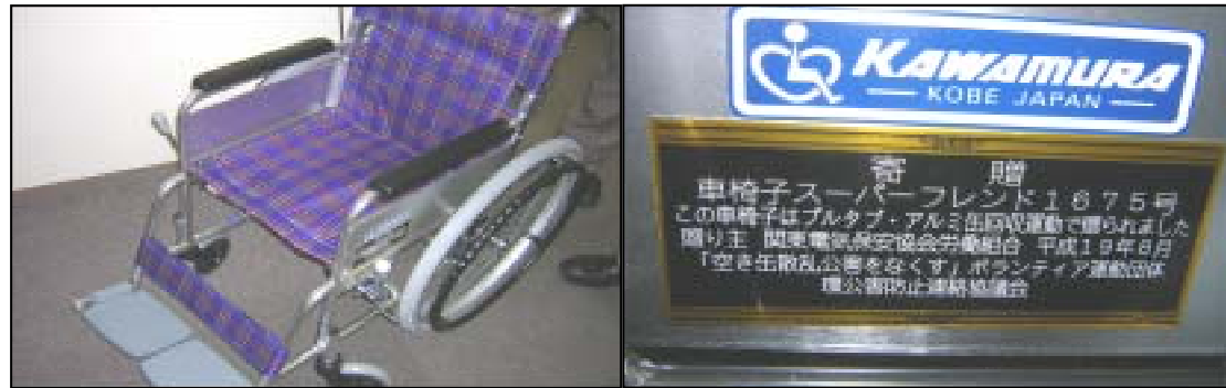
寄贈させて頂いた車椅子

本年7月に総回収量が800kgに達成したことから、東京南支部をつうじ2台目を8月30日(木)品川区社会福祉協議会に寄贈することができました。今後も社会貢献活動として職場の協力をいただきながら取り組んでいきますので宜しくお願いいたします。